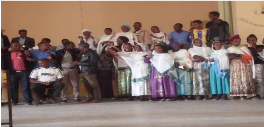
ናይ ውቕሮ ኮሚቴ መረፃ