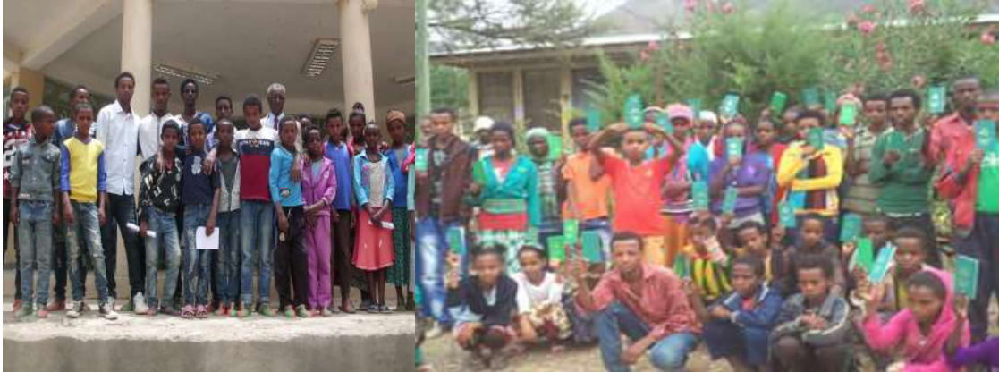
ተምሃሮ ድሕሪ ሽልማት