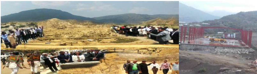
STVET-APICC (ኢ.ሮብ ካላዓሳ)