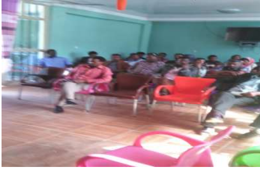
ናይ ዳውሃን ኮሚቴ መረፃ