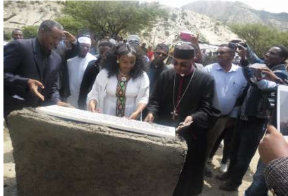
STVET-APICC (ኢ.ሮብ ካላዓሳ) እምኒ ኩርናዕ እንትቐመጥ /14/01/2009 ዓ.ም