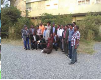
ናይ መቐለ ኮሚቴ መረፃ