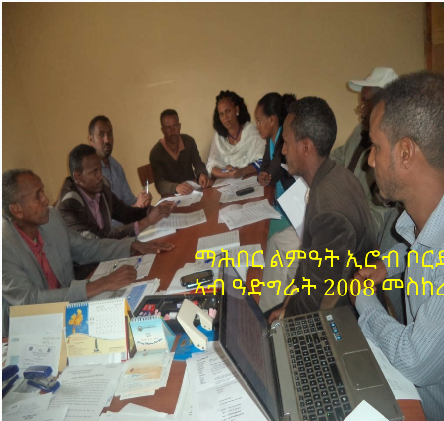
ማሕበር ልምዓት ኢሮብ ቦርድ ናይ መጀመሪያ ኣኼባ ኣብ ዓድግራት 2008 መስከረም